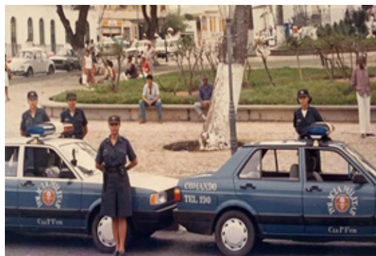
Figura 1 - Policiais femininas na Vila Policial Militar do Bonfim e nas ruas (1990)