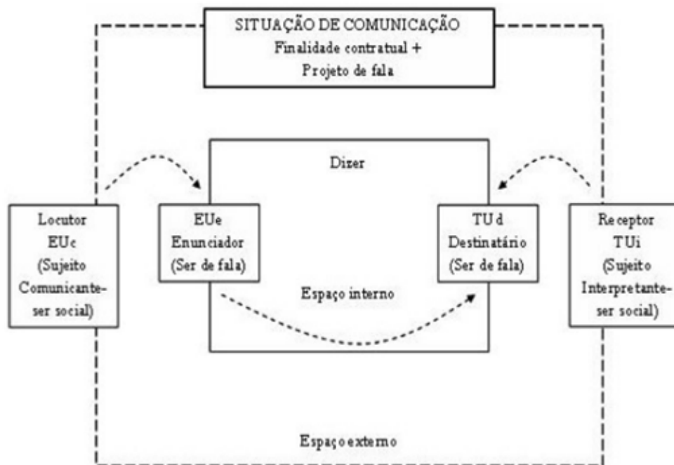
Figura 2 – Sujeitos da linguagem. Charaudeau (2016, p. 77)

Assim, o autor amplia tal quadro, desdobrando as tradicionais figuras dos sujeitos em quatro: Sujeito Comunicante (EUc), Sujeito Enunciador (EUe), Sujeito Destinatário (TUd) e Sujeito Interpretante (TUi).