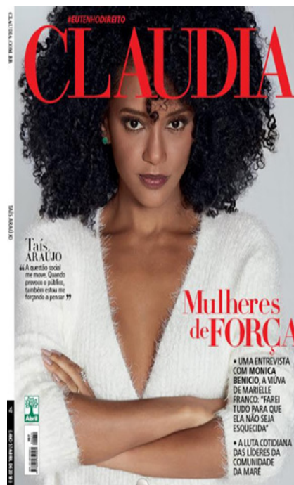
Figura 7 - Claudia , 04/2018

Dentro desse novo contexto, observa-se que a capa publicada em abril de 2018 já chama a atenção do leitor por conta da escolha da personalidade selecionada para estampá-la, a atriz brasileira Taís Araújo.