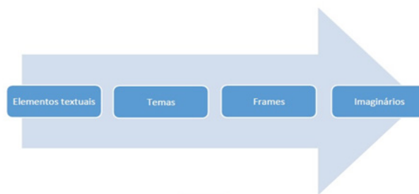
Figura 3 – Proposta de organização dos conceitos relativamente às categorias abordadas

Por conseguinte, é possível afirmar que a formação de imaginários se dê pelo estabelecimento dos frames que emolduram uma noção. Os frames , por sua vez, são constituídos por temas, que se constroem a partir de elementos textuais, trazendo assim uma compreensão coletiva mais ampliada sobre os objetos que compõem o mundo. A orientação dos elementos textuais a imaginários sociodiscursivos se mostra sintetizada no esquema a seguir, que indica condução cognitiva da formação de imaginários, sem menção à ordem temporal de constituição dos conceitos abordados.