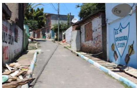
Figura 17: Travessa P em 2014.