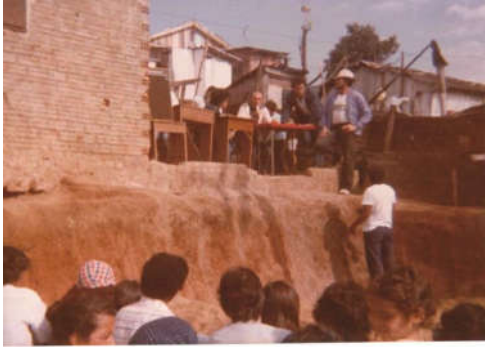
Figura 7: Assembleia de moradores em 1984.