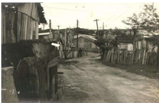
Figura 18: Rua Padre Lima em 1982.