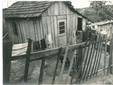
Figura 10: Casas da vila Cruzeiro do Sul em 1974.