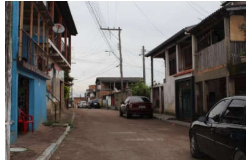
Figura 12: Casa da vila Cruzeiro do Sul em 2014.