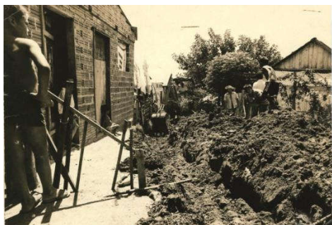
Figura 16: Travessa P em 1982.