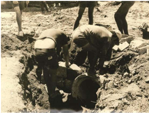
Figura 9: Mutirão Pró-Esgoto.