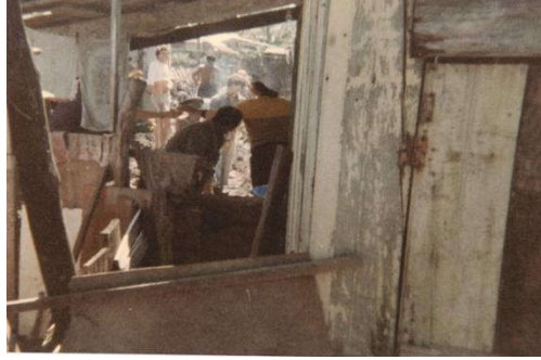
Figura 8: Mutirão Pró-esgoto.