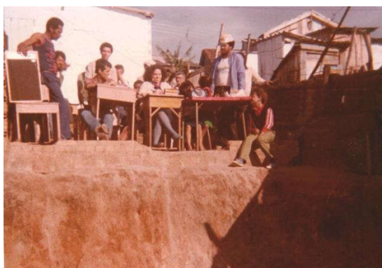
Figura 6: Assembleia de moradores em 1984.

É neste recorte, de tempo e espaço, onde histórias sobre as transformações do território da Vila Cruzeiro do Sul são contadas, que o uso da linguagem visual, delimita em suas formas simbólicas (Rocha, 1995), o sentido de pertencimento coletivo. No que se refere às fotografias da Vila Cruzeiro do Sul, elas sensibilizaram e incentivaram que os moradores falassem sobre a relação que eles estabelecem com o espaço onde habitam, bem contribuíram na sua identificação como parte desta comunidade, conforme revelam as imagens a seguir: