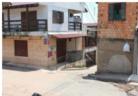
Figura 15: Travessa B em 2014.