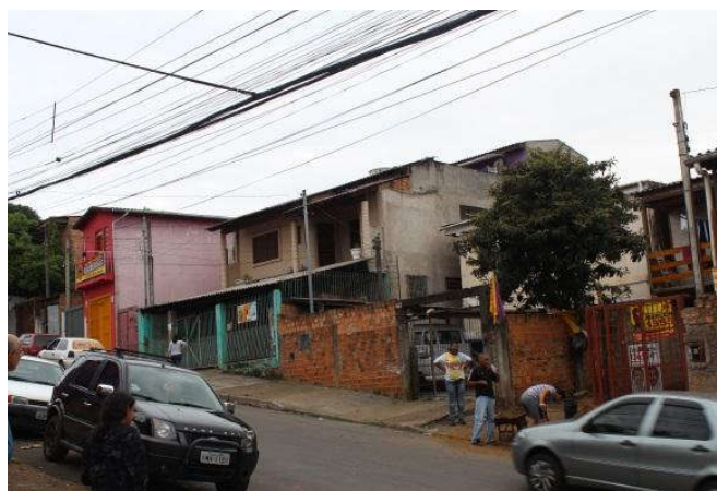
Figura 13: Casa da vila Cruzeiro do Sul em 2014.