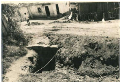
Figura 14: Travessa B em 1978.

Já faz uns 50 anos que moro aqui e antes era muito ruim. Antes deles tomarem conta da Associação para poder melhorar a vila, depois que a Associação começou ir atrás para melhorar, melhorou muito, ficou muito bom e agora tá melhor ainda, cada vez vai melhorando mais. Antigamente não tinha água, não tinha luz, não tinha nada. Aí depois, mais tarde, começou vir a luz, a água, mas isso com muito trabalho pra esse pessoal conseguir. Foi a Associação que trabalhou muito pra arrumar. Antes cada um fazia as casinhas que podiam fazer, depois foi melhorando. Os moradores tinham casa de madeira, agora casa de madeira quase não se vê mais. (Entrevista com Dona P. S. D. - 10/11/2014).