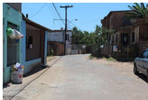
Figura 19: Rua Padre Lima em 2014. Fonte: Arquivo pessoal.

Na busca por conhecer o território da Vila Cruzeiro do Sul, é possível perceber que ali se encontram indivíduos que embora lidem com significativas restrições financeiras, com carência de alimentos, com moradias precárias, há também uma história de personagens, que apesar da precariedade onde vivem, lutam para sobreviver. E que esta região, que abriga muitas famílias, é fruto da (re)invenção, dos afetos, dos sonhos e da solidariedade das pessoas que ali residem. As trajetórias de lutas e de mobilização social dos moradores da Vila Cruzeiro do Sul remontam, através das narrativas, a forma de construção de suas identidades e representam, no trabalho de campo, elementos centrais para a rede que vem se constituindo ao longo da presente pesquisa.