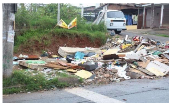
Figura 3: Vila Cruzeiro do Sul – Esquina da Rua Dona Otília e da Travessa B.