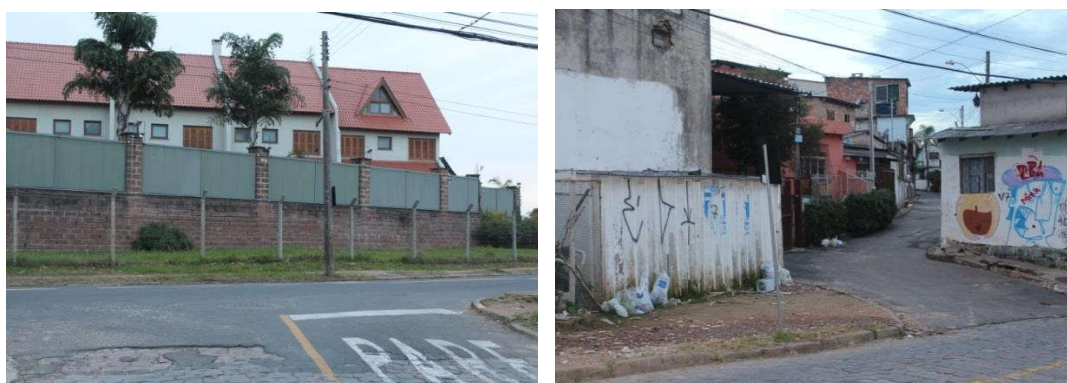
Figuras 4: Condomínio residencial Bairro Santa Teresa.

Para o caso da cidade de Porto Alegre, as formas assumidas pelas habitações na cidade, em especial nas áreas residenciais das camadas médias urbanas, que vivem próximas da região da Grande Cruzeiro, não é exceção e revela, na sua complexidade, a distribuição desigual dos espaços socialmente construídos e das formas de sociabilidades, que indicam as maneiras como os indivíduos se deslocam, estabelecem aproximações e afastamentos (Simmel, 1987; Guerra, 2020). O que bem pode ser percebido na arquitetura urbana da cidade e bastante visível na região da Grande Cruzeiro, que fica a poucos metros de regiões mais valorizadas da cidade, com a presença de condomínios fechados e de forte esquema de segurança.