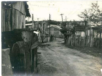
Figura 11: Casas da vila Cruzeiro do Sul em 1974.