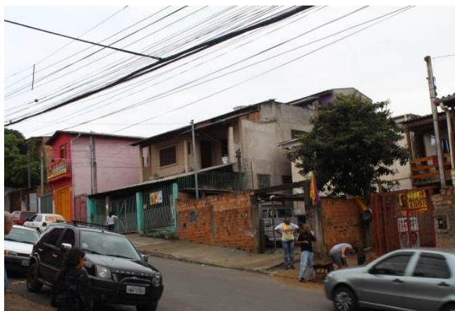
Figura 13: Casa da vila Cruzeiro do Sul em 2014.