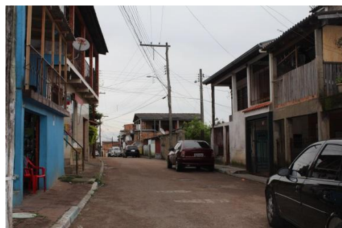
Figura 12: Casa da vila Cruzeiro do Sul em 2014.