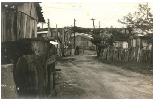
Figura 18: Rua Padre Lima em 1982.