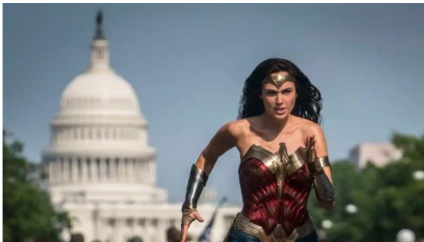
Figura 3: Imagem do filme “The Wonder Woman”, 1984.

Para concluir, esqueçamos por momentos o ocorrido no passado recente no Capitólio (que não deixa de ser grave!) e outras mil e uma questiúnculas diárias. Meditemos no futuro próximo com seriedade, a não ser que queira começar a aprender “mandarim”, a língua oficial chinesa. Nem a Mulher Maravilha nos salvará da zombificação total se não estivermos alerta. Corta!!