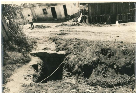
Figura 14: Travessa B em 1978.

Já faz uns 50 anos que moro aqui e antes era muito ruim. Antes deles tomarem conta da Associação para poder melhorar a vila, depois que a Associação começou ir atrás para melhorar, melhorou muito, ficou muito bom e agora tá melhor ainda, cada vez vai melhorando mais. Antigamente não tinha água, não tinha luz, não tinha nada. Aí depois, mais tarde, começou vir a luz, a água, mas isso com muito trabalho par esse pessoal conseguir. Foi a Associação que trabalhou muito pra arrumar. Antes cada um fazia as casinhas que podiam fazer, depois foi melhorando. Os moradores tinham casa de madeira, agora casa de madeira quase não se vê mais. (Entrevista com Dona P. S. D. - 10/11/2014).