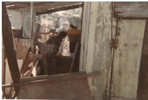
Figura 8: Mutirão Pró-esgoto.