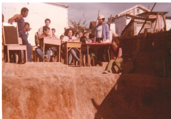
Figura 6: Assembleia de moradores em 1984.

É neste recorte, de tempo e espaço, onde histórias sobre as transformações do território da Vila Cruzeiro do Sul são contadas, que o uso da linguagem visual, delimita em suas formas simbólicas (Rocha, 1995), o sentido de pertencimento coletivo. No que se refere às fotografias da Vila Cruzeiro do Sul, elas sensibilizaram e incentivaram que os moradores falassem sobre a relação que eles estabelecem com o espaço onde habitam, bem contribuíram na sua identificação como parte desta comunidade, conforme revelam as imagens a seguir: