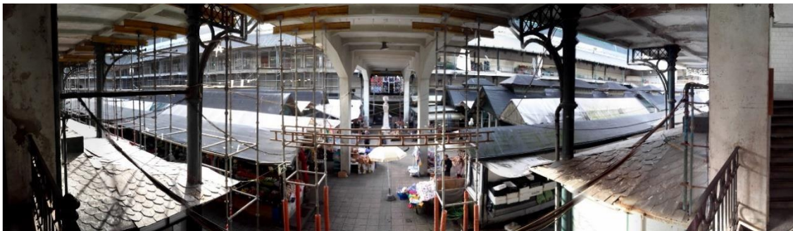
Figura 4: Fotografia panorâmica do Centro do Mercado, varanda do piso intermédio da Rua Alexandre Braga.