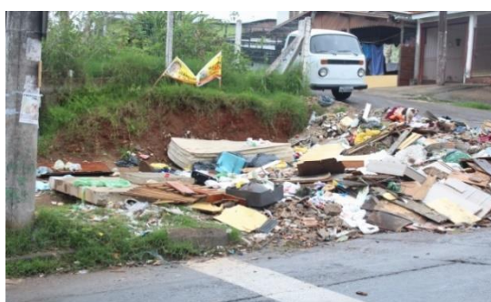
Figura 3: Vila Cruzeiro do Sul – Esquina da Rua Dona Otilia e da Travessa B.