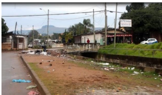
Figura 2: Acesso à Vila Cruzeiro do Sul pelo bairro Cristal.

A localização geográfica também não contribui com o sistema de escoamento. A Vila Cruzeiro do Sul, assim como as demais vilas que compõem a Região da Grande Cruzeiro, ficam entre morros e, com as chuvas, o lixo é arrastado, contaminando o solo e provocando a obstrução da canalização de esgotos. O sistema de coleta de lixo também é precário, pois algumas ruas são estreitas, o que dificulta a entrada dos caminhões e o lixo acumula-se nas calçadas, conforme se pode observar nas imagens a seguir.