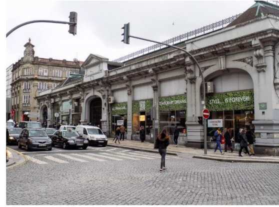
Figura 3: Fotografia do exterior do Mercado do Bolhão (Rua Fernandes Tomás).