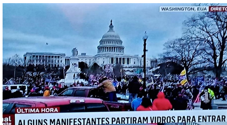
Figura 2: Imagem de uma reportagem televisiva (6 de fevereiro de 2021).

Ao ver aqueles seres zombificados a invadirem o Capitólio, uns trepando pelas paredes e muros, outros a partir janelas, correndo pelas escadas acima do interior do edifício governamental, símbolo máximo da Democracia americana, e mesmo mundial, alguns deles com indumentárias bizarras, os gritos, a “simpatia” de alguns policiais brancos para com aquela ferocidade digna dos hunos ou dos vândalos do passado distante, apenas me ocorreu o filme “Terra dos Mortos” do falecido realizador G. Romero. Foi uma sensação de déja vu só que desta feita não estava a ver uma ficção. Eu e milhões de pessoas vimos a Arte ser transformada em realidade vista e vivida, da mesma forma que no 11 de setembro vimos a desgraça que se abateu sobre as torres gémeas.