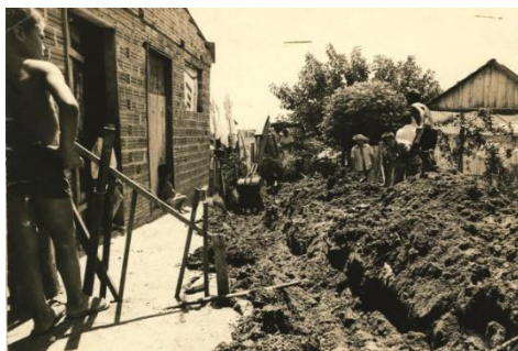
Figura 16: Travessa P em 1982.