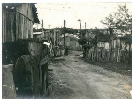
Figura 11: Casas da vila Cruzeiro do Sul em 1974.