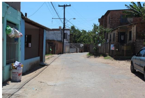
Figura 19: Rua Padre Lima em 2014. Fonte: Arquivo pessoal.

Na busca por conhecer o território da Vila Cruzeiro do Sul, é possível perceber que ali se encontram indivíduos que embora lidem com significativas restrições financeiras, com carência de alimentos, com moradias precárias, há também uma história de personagens, que apesar da precariedade onde vivem, lutam para sobreviver. E que esta região, que abriga muitas famílias, é fruto da (re)invenção, dos afetos, dos sonhos e da solidariedade das pessoas que ali residem. As trajetórias de lutas e de mobilização social dos moradores da Vila Cruzeiro do Sul remontam, através das narrativas, a forma de construção de suas identidades e representam, no trabalho de campo, elementos centrais para a rede que vem se constituindo ao longo da presente pesquisa.