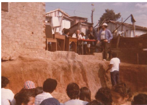
Figura 7: Assembleia de moradores em 1984.