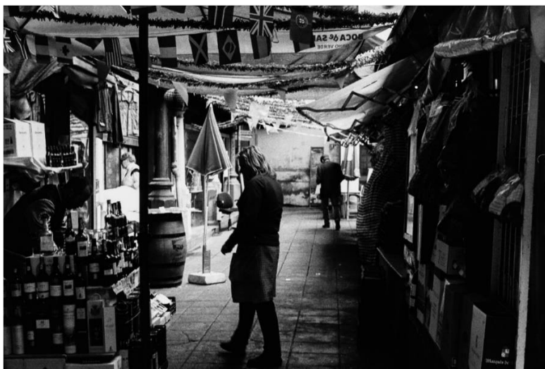
Figura 1: Fotografia relativa ao comércio de Vinhos e Salgados dentro do Mercado do Bolhão (piso inferior).

reiteram, por sua medida, sentimentos mais profundos sobre o mesmo, onde se destacam histórias particulares de cada comerciante em determinados espaços.