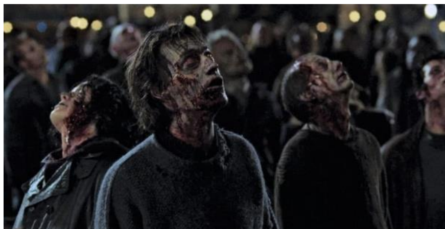
Figura 1: Imagem do filme “Terra dos Mortos” de G. Romero.