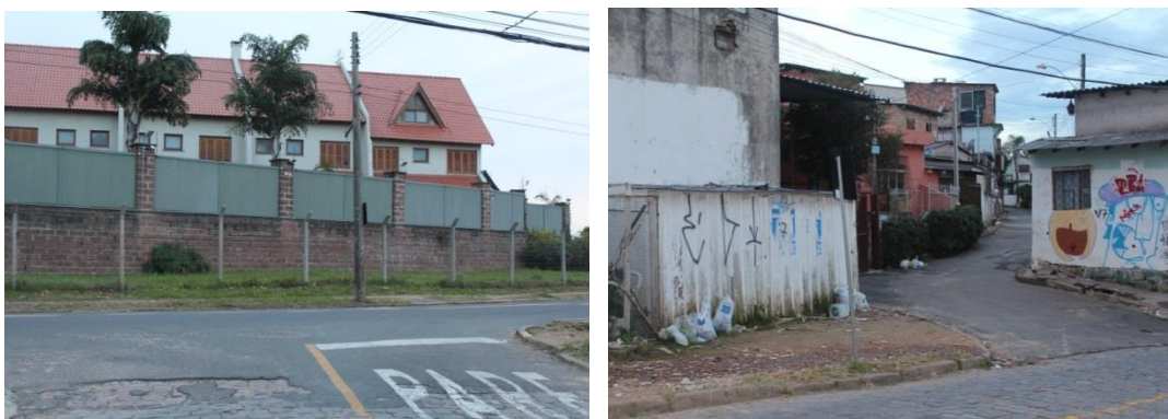
Figuras 4: Condomínio residencial Bairro Santa Teresa.

Para o caso da cidade de Porto Alegre, as formas assumidas pelas habitações na cidade, em especial nas áreas residenciais das camadas médias urbanas, que vivem próximas da região da Grande Cruzeiro, não é exceção e revela, na sua complexidade, a distribuição desigual dos espaços socialmente construídos e das formas de sociabilidades, que indicam as maneiras como os indivíduos se deslocam, estabelecem aproximações e afastamentos (Simmel, 1987; Guerra, 2020). O que bem pode ser percebido na arquitetura urbana da cidade e bastante visível na região da Grande Cruzeiro, que fica a poucos metros de regiões mais valorizadas da cidade, com a presença de condomínios fechados e de forte esquema de segurança.