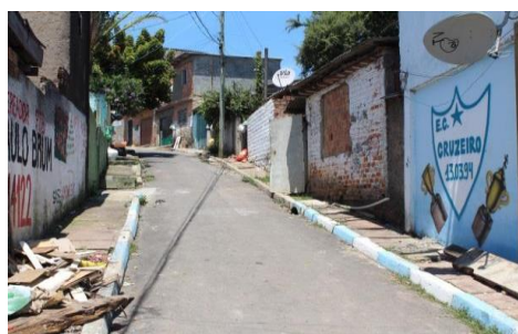
Figura 17: Travessa P em 2014.