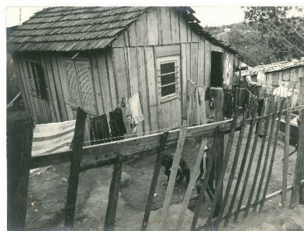
Figura 10: Casas da vila Cruzeiro do Sul em 1974.