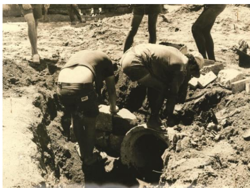
Figura 9: Mutirão Pró-Esgoto.