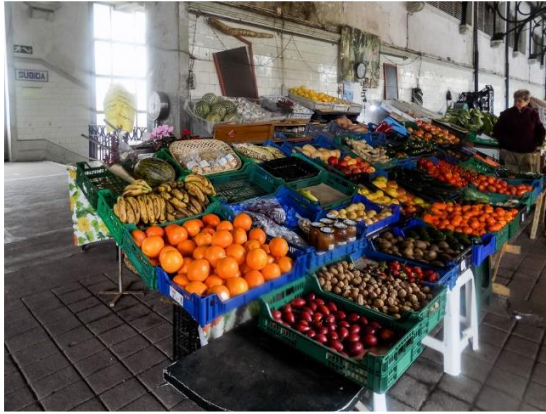
Figura 2: Fotografia do interior do Mercado do Bolhão (entrada Rua Sá da Bandeira piso superior).