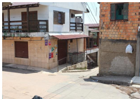
Figura 15: Travessa B em 2014.