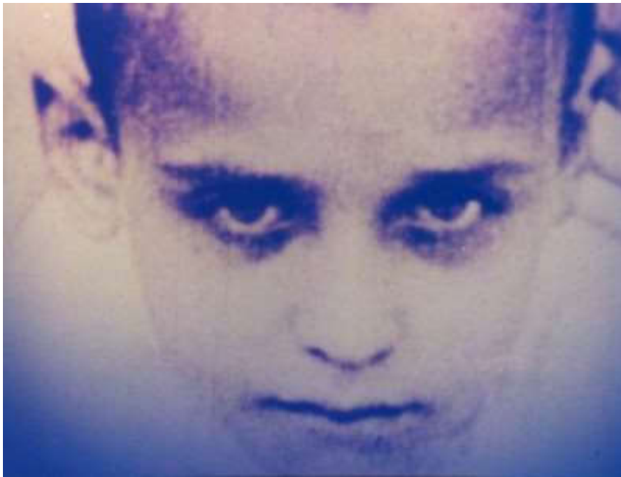
Figura 4: Frame de “Oh! Uomo”