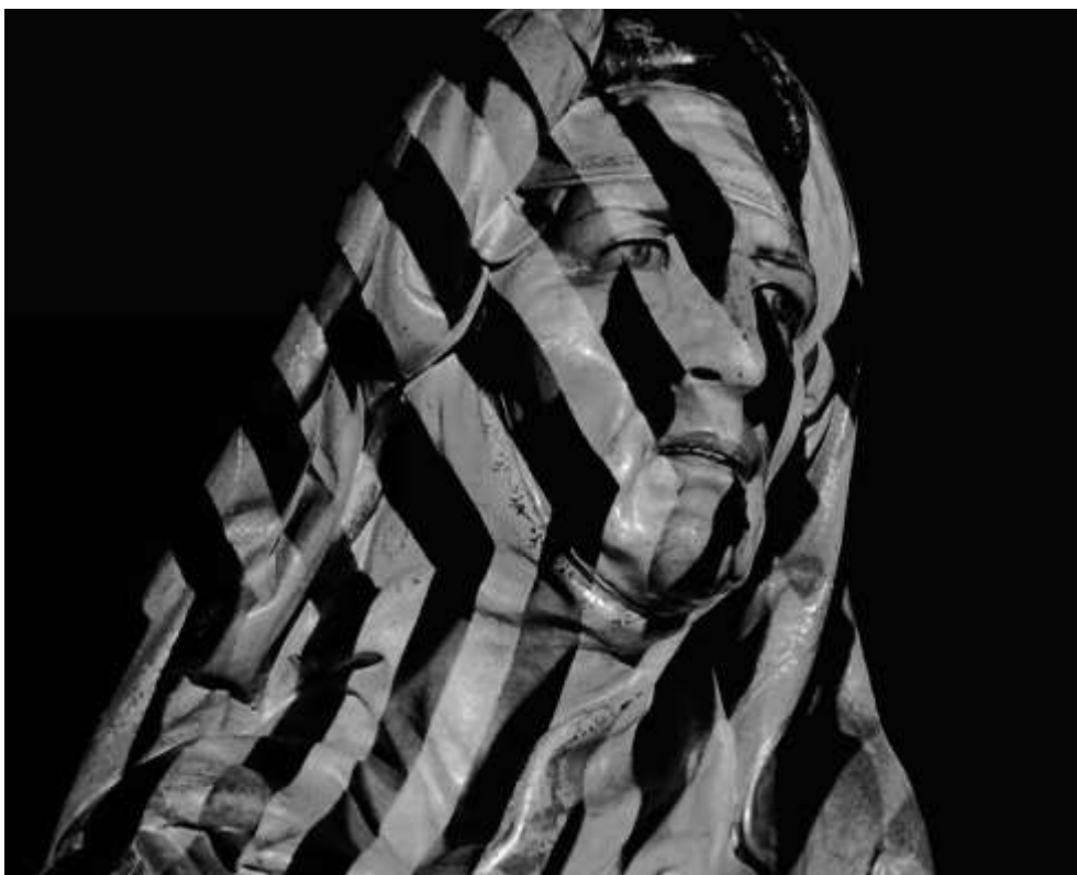
Figura 5: Frame de “Fuego en Castilla”

Só nos fica a faltar a projeção como experienciada em 1960, que ultrapassava os limites da tela, espalhando-se abstratamente pela sala de cinema. Esta forma precoce de cinema expandido, designada “desbordamiento apanorámico de la imagen”, é irrepetível uma vez que o seu dispositivo óptico perdeu-se.