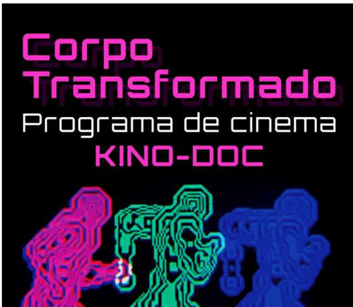
Figura 1: Artwork do programa

O KINO-DOC, núcleo de cinema de cursos de documentário presenciais e online, apresentou mais um programa na Universidade do Porto. “Corpo Transformado” é constituído por 40 filmes, na sua maioria exploratórios e de cariz documental, que dão a ver transformações do próprio corpo – humano ou de outros animais – e corpos transformados pelo cinema, vídeo e por imagens científicas utilizadas no domínio artístico. Cinco sessões nos dias 8, 9 e 10 de abril de 2022. Pela brutalidade gráfica que contém, os filmes sinalizados com “*” são para maiores de 18 anos, e também devem ser evitados por espectadores mais sensíveis. Todas as sessões possuíam legendas em português.