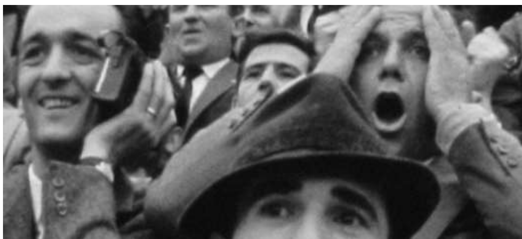
Figura 3: Frame de “Evasi”

Não será despiçando o plano de uma fábrica, numa altura em que a partida já acabara, ficando as bancadas descobertas da moldura humana mas cobertas de lixo. Seriam operários muitos daqueles “evadidos” (como se enuncia no título da obra). Já os planos da lua fazem pensar em Tobe Hooper, que dizia que filmava a lua por esta ser um símbolo ancestral da loucura.