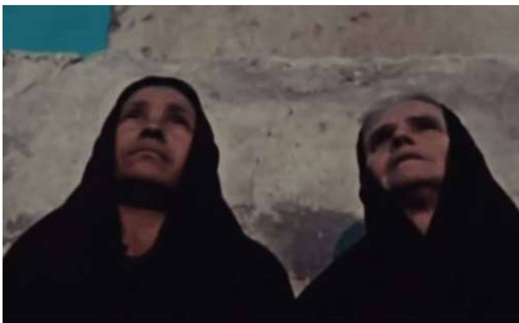
Figura 6: Frame de “Pasqua in Sicilia”

PASQUA IN SICILIA é um resgate etnográfico para memória futura da celebração da Páscoa, de meados do século XX, em três aldeias sicilianas, que nos faz lembrar tradições portuguesas. Em San Fratello, homens transformam-se por máscaras e trajes coloridos, semelhantes aos caretos transmontanos, em judeus satânicos. Em Delia, como Manoel de Oliveira fará posteriormente no início da década de 60 em “Acto da Primavera”, Vittorio De Seta filma uma encenação popular da Paixão de Cristo, na qual o messias, primeiramente encarnado num homem, ganha o corpo de um boneco de madeira quando sobe à cruz. Em Aidone, no domingo pascal, há outros bonecos do folclore religioso, tão grandes e animados como os gigantones lusos, mas mais velozes, estranhos e misteriosos, que representam apóstolos.