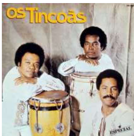
Figura 5: Capa do disco de 1982