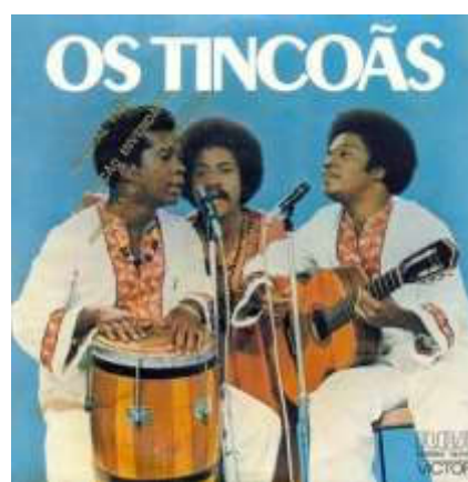
Figura 2: Capa do disco de 1976