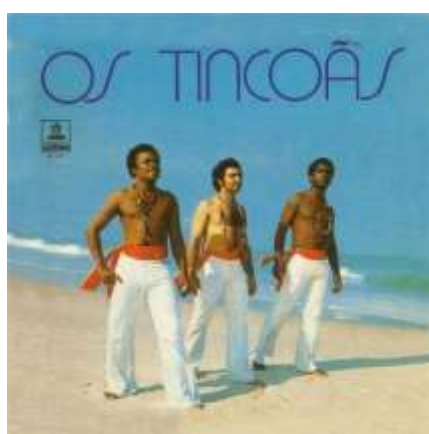
Figura 1: Capa do disco de 1973

Destarte os consumidores de música haveriam de assumir uma atitude de desvalorização relativamente à importância das capas e dos elementos gráficos e visuais sui generis, dos booklets contendo diversa informação visual e textual complementar aos discos propriamente ditos. Levando-se em consideração que nas sociedades contemporâneas os discos não são físicos, vê-se a concretização do processo de desmaterialização dos discos e CDs, o que acaba por conferir às capas dos discos uma maior importância visual e representativa, contrariando assim o que fora exposto por Straw anteriormente.