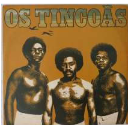
Figura 3: Capa do disco de 1977