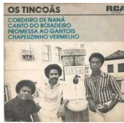
Figura 4: Capa do disco de 1978