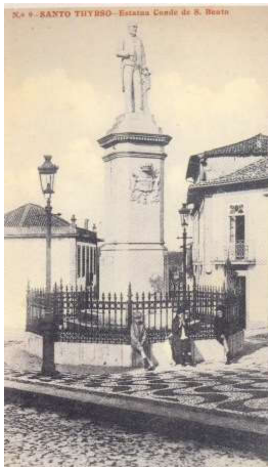
Figura 3: A estátua e sua envolvente. Postal da época (início do séc. XX)

progressivamente se tornou central na vila. O espaço envolvente foi calcetado e colocado um gradeamento, aspeto este que se manteve por largos anos, até à mudança da estátua, no decurso da década de 50 do século XX, para a atual localização na Praça Conde de S. Bento (perto da antiga residência do Conde de S. Bento).