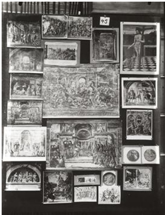
Figura 6: «Mnemosyne-Atlas», Nr. 33, 1926