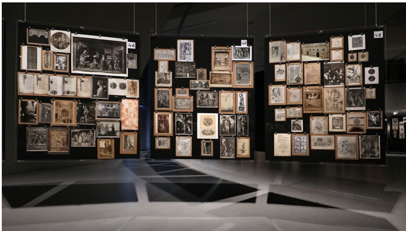
Figura 1: Aby M. Warburg, «Mnemosyne-Atlas», 1924 – 1929