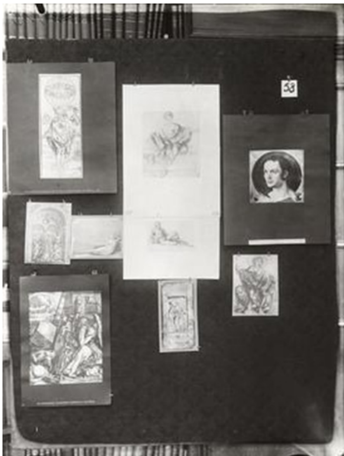
Figura 5: «Mnemosyne-Atlas», Board 58, 1926