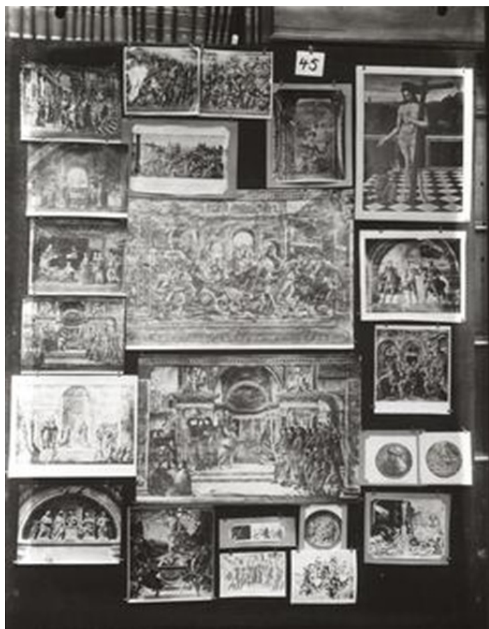
Figura 4: «Mnemosyne-Atlas», Nr. 45, 1924