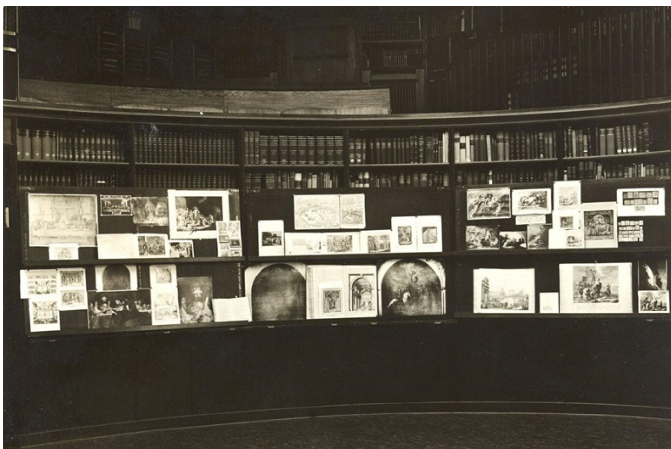
Figura 2: Aby M. Warburg, «Mnemosyne-Atlas», 1924 – 1929

Fonte: Mnemosyne-Atlas, Boards of the Rembrandt-Exhibition, 1926, Photography.