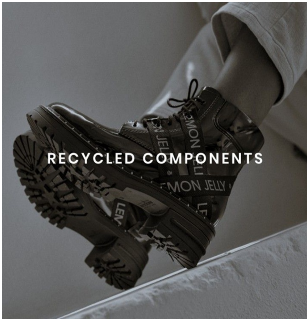
Figura 6: Botas Lemon Jelly, produzidas a partir de materiais sintéticos reciclados

muito acentuado das vendas online . “Também a sustentabilidade veio para ficar. Esta é a grande mudança dos nossos tempos. A sustentabilidade, por si só, justifica um novo choque estratégico”. E é com base nestas premissas que a APICCAPS prepara o Plano Estratégico para a próxima década, que, de acordo com Onofre (2022) será apresentado em setembro deste ano.