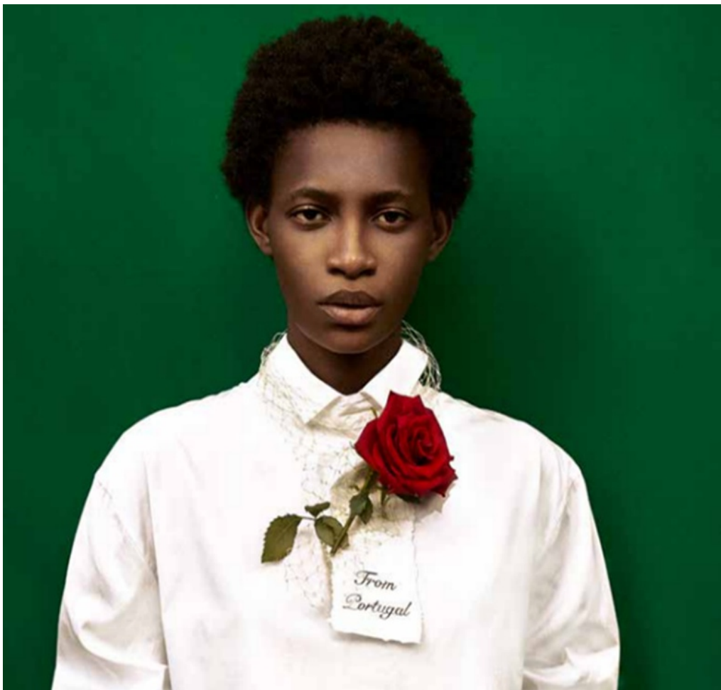
Figura 9: Modelo a apresentar a Organic cotton shirt by RDD

Assim, para concluir, podemos afirmar que a moda, especialmente na confluência da década de 1970 e 1980, foi essencial para o surgimento de disposições cosmopolitas na sociedade portuguesa, tendo começado inicialmente em jovens urbanos da classe média, especialmente na cidade de Lisboa, mas que depois rapidamente se alastrou para o resto da população, nomeadamente através do surgimento das lojas pronto-a-vestir e os vários centros comerciais que começaram a aparecer na década de 1980. De um país com um atraso crónico em relação às últimas tendências no mundo da moda, hoje existe uma verdadeira indústria criadora têxtil no nosso país, que se encontra na linha da frente em matérias de sustentabilidade e novas tecnologias, mas que, paradoxalmente, ainda convive com uma indústria têxtil produtora marcada pelos baixos salários e baixa produtividade, com crescentes dificuldades em competir com salários ainda mais baixos, como é o caso dos países do Sudoeste asiático.