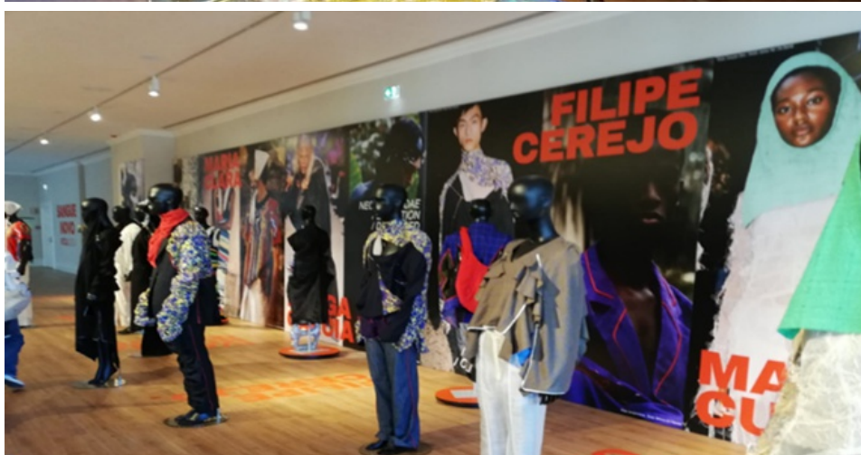
Figuras 7 e 8: Exposição temporária, “Next Generation”, com os talentos emergentes do BLOOM, patente no Museu da Moda e dos Têxteis do WOW entre 12 de novembro de 2021 até 9 de janeiro de 2022