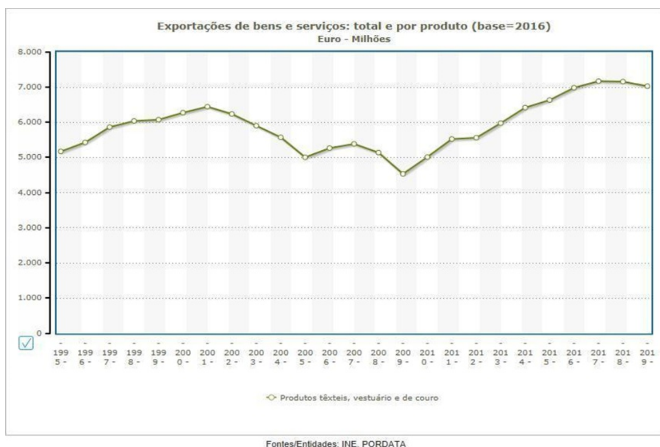
Figura 5: Exportações de produtos têxteis, vestuário e de couro, entre 1995 e 2019

O mesmo fenómeno se registou na indústria do calçado, que, apesar de estar assente num tecido industrial marcado pela predominância de micro e pequenas empresas, tem conseguido adaptar-se às mudanças e assumir uma posição competitiva bastante sustentável. O gráfico apresentado na Figura 5 permite-nos, assim, observar o percurso destes setores produtivos (com caráter fundamentalmente exportador), a partir da análise das exportações registadas entre os anos 1995 e 2019, evidenciando que, após uma queda de relevo no período da crise financeira mundial, os setores têm seguido um percurso claramente ascendente.