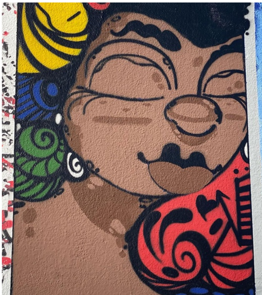
Figura 3. Graffiti intitulado Pretogalidade de Ser (2022), de Moami. Lisboa, painel “48 artistas, 48 anos de liberdade” (2022)

Tal como referido, a obra Pretogalidade de ser (Figura 3) é parte integrante do painel denominado 48 artistas, 48 anos de liberdade (2022), graffiti pintado coletivamente em Lisboa, que representa uma releitura do histórico Painel do Mercado do Povo (1974), feito em comemoração à Revolução de 25 de Abril.