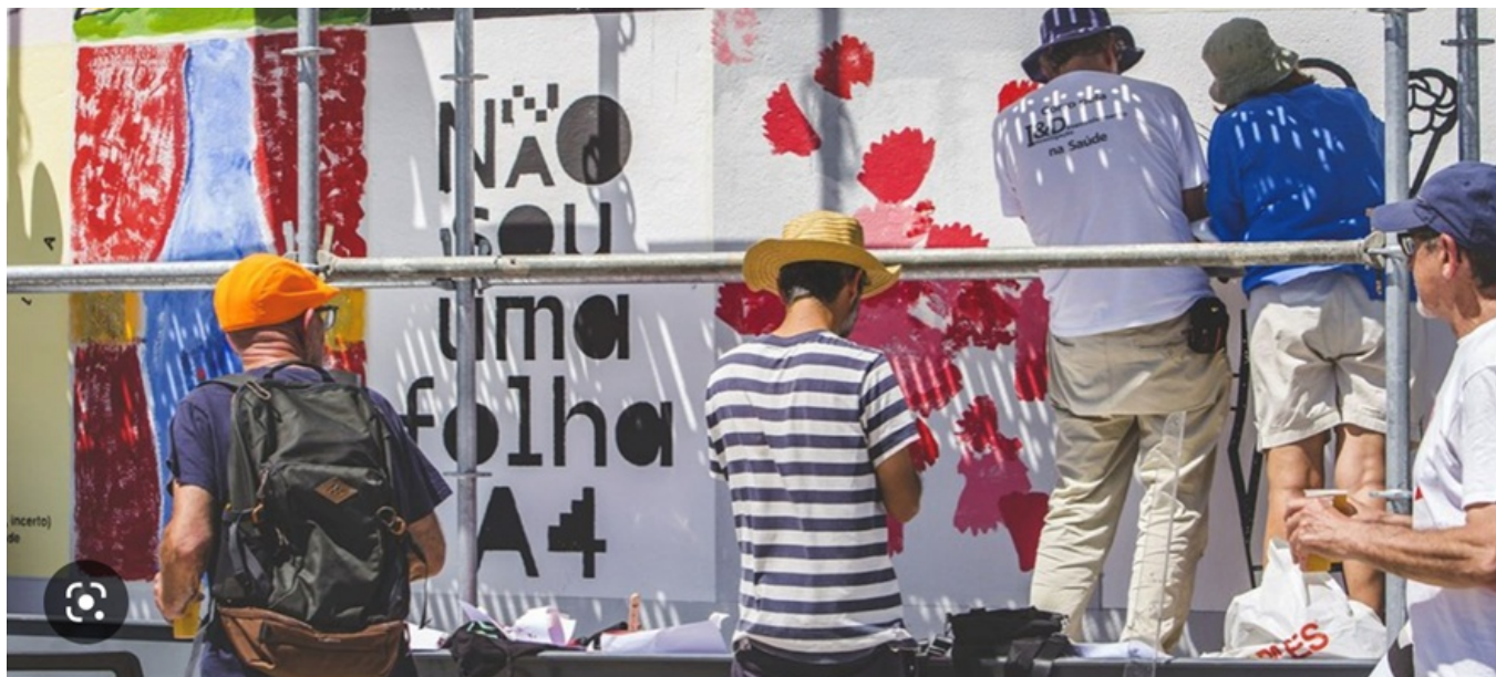
Figura 2: Painel “48 artistas, 48 anos de liberdade” (2022)