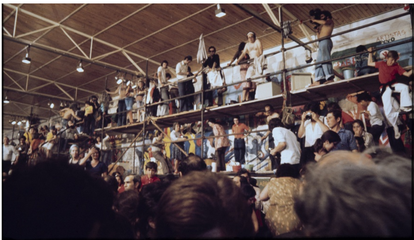
Ernesto de Sousa | Pintura do mural coletivo do Movimento Democrático dos Artistas Plásticos, no Mercado do Povo em Belém, 1974.

O Painel do Mercado do Povo (Figura 1) constitui uma obra coletiva pintada em 10 de junho de 1974, na Galeria de Arte Moderna, situada em Lisboa, realizada por 48 artistas. Seu significado ficou marcado pela celebração da Revolução do 25 de Abril e fim de 48 anos de ditadura fascista em Portugal. Esse painel foi promovido pelo Movimento Democrático dos Artistas Plásticos (MDAP), organização recém-formada na época (Expresso.pt, 2022; Comissão Comemorativa, 2022), e tornou-se emblemático por revelar as primeiras manifestações artísticas realizadas após a revolução (Cruzeiro, 2021; Alves, 2021; Almeida, 2009).