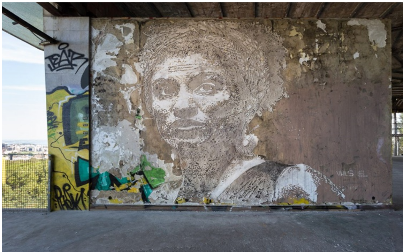
Figura 1: Obra de Vhils “Mariele Franco.

reabilitação de espaços do patrimônio público e o aproveitamento e/ou uso ecológico de materiais. O objetivo principal seria o de promover a reabilitação social e econômica, através das práticas e intervenções artísticas, com vistas à movimentação da economia local, geração de empregos e turismo. Esta abordagem tem vindo a chamar a atenção de gestores públicos da cultura até pela notoriedade que pode causar. Contudo, aqui não se pode deixar de colocar o ponto de que os discursos e as ações institucionais podem não assegurar práticas efetivamente ecológicas ou ser socialmente sustentáveis a longo prazo. Sobre desenvolvimento sustentável, é importante não reproduzirmos meramente os discursos políticos e institucionais para não adentrarmos a uma abordagem neutra do tema (Krieg-Planque, 2010). Um exemplo deste enfoque de reabilitação urbana é o artista português Vhils - Alexandre Farto - que tem como característica a interação entre obra de arte, ambiente urbano e reabilitação de espaço público. O seu trabalho artístico reflete sobre o impacto da urbanidade, do desenvolvimento e da uniformização global sobre as paisagens e a identidade das pessoas. Segundo o editor do Vhils Studio, Miguel Moore, o artista opta pela técnica de escultura em baixo-relevo que constitui a base do projeto Scratching the Surface , apresentado em 2007 na exposição coletiva VSP em Lisboa (Vhils, 2023) 1 . O exemplo da técnica de Vhils pode ser vista na figura 1.