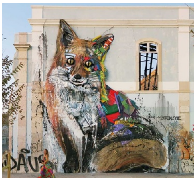
Figura 2: Big trash animals- Half Fox (2017). Foto: Bordalo II Fonte: www.bordaloii.com

Ao mesmo tempo em que emergência climática vem sendo tratada de forma recorrente no âmbito das culturas contemporâneas, nota-se o crescimento de projetos e artistas portugueses que desenvolvem um trabalho de arte ecológica, abordam o tema em uma ou mais fases do processo criativo ou ainda que consideram o ativismo ambiental como identidade das suas criações. Ao lado de Vhils, Bordalo II - Artur Bordalo - é um dos artistas portugueses de alcance global que tem seu processo criativo vinculado ao ativismo. Ele é conhecido por suas esculturas e instalações que têm uma forte ênfase na reciclagem e na crítica socioambiental. As suas esculturas representam animais de espécies em vias de extinção. Ele usa essas esculturas para destacar questões ambientais, tais como a poluição, a degradação do habitat e o impacto do lixo e do consumo na natureza. O trabalho do artista caracteriza-se por uma ação de protesto contra a destruição do meio ambiente e uma chamada à ação, tanto para a conscientização ambiental, quanto para outros temas relevantes para as sociedades, como aconteceu na sua intervenção sobre a crise na habitação em Portugal, em setembro de 2023 (Bordalo II, 2023) 3 .