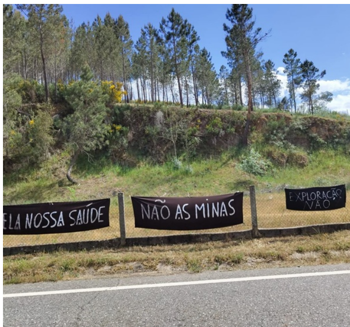
Figura 5: Intervenção do projeto Terra Batida no Fundão

artistas realizaram sessões de conversa sobre temas ambientais com alunos de um Agrupamento de Escolas, caminhadas-conversa com grupos ativistas locais, práticas de leitura, exibição de filme, sessões para apresentação de projetos artísticos locais e intervenções.