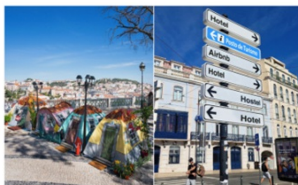
HABITAÇÃO Bordalo II monta tendas em Lisboa para criticar o “desalojamento local” O artista Bordalo II montou em Lisboa várias tendas transformadas em casa, zonas onde só existem hotéis e outras que só permitem a entrada de turistas, nómadas digitais e vistos gold.