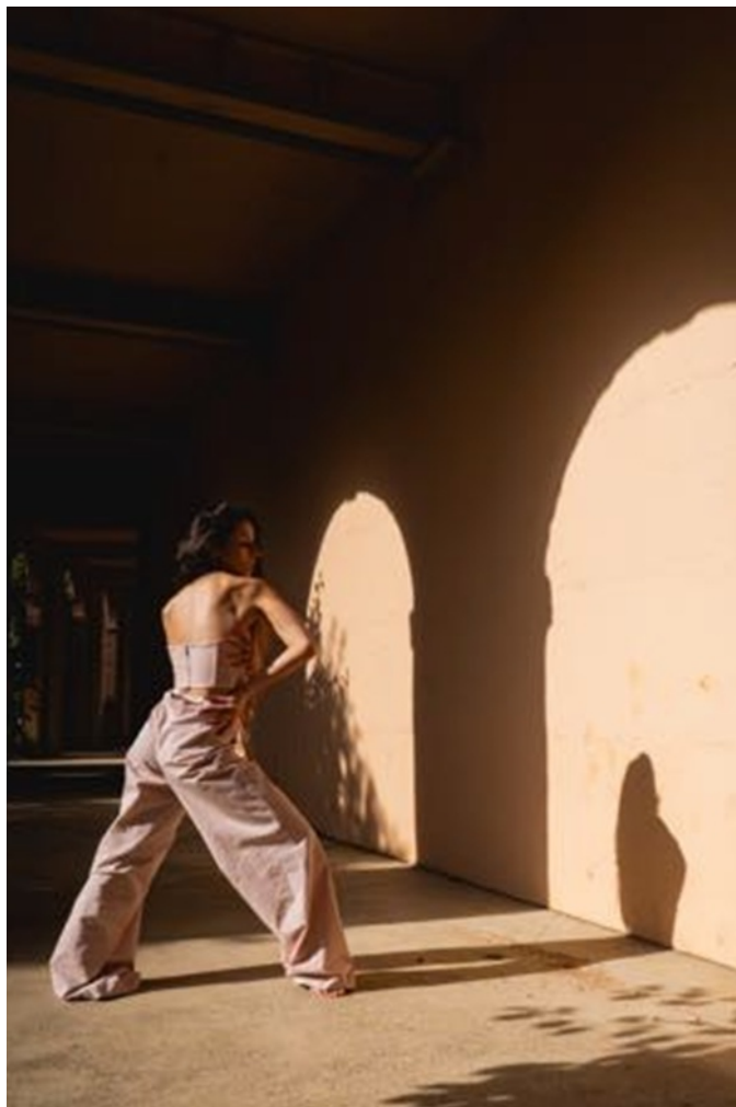
Figura 1: O desenvolvimento coreográfico das danças de rua