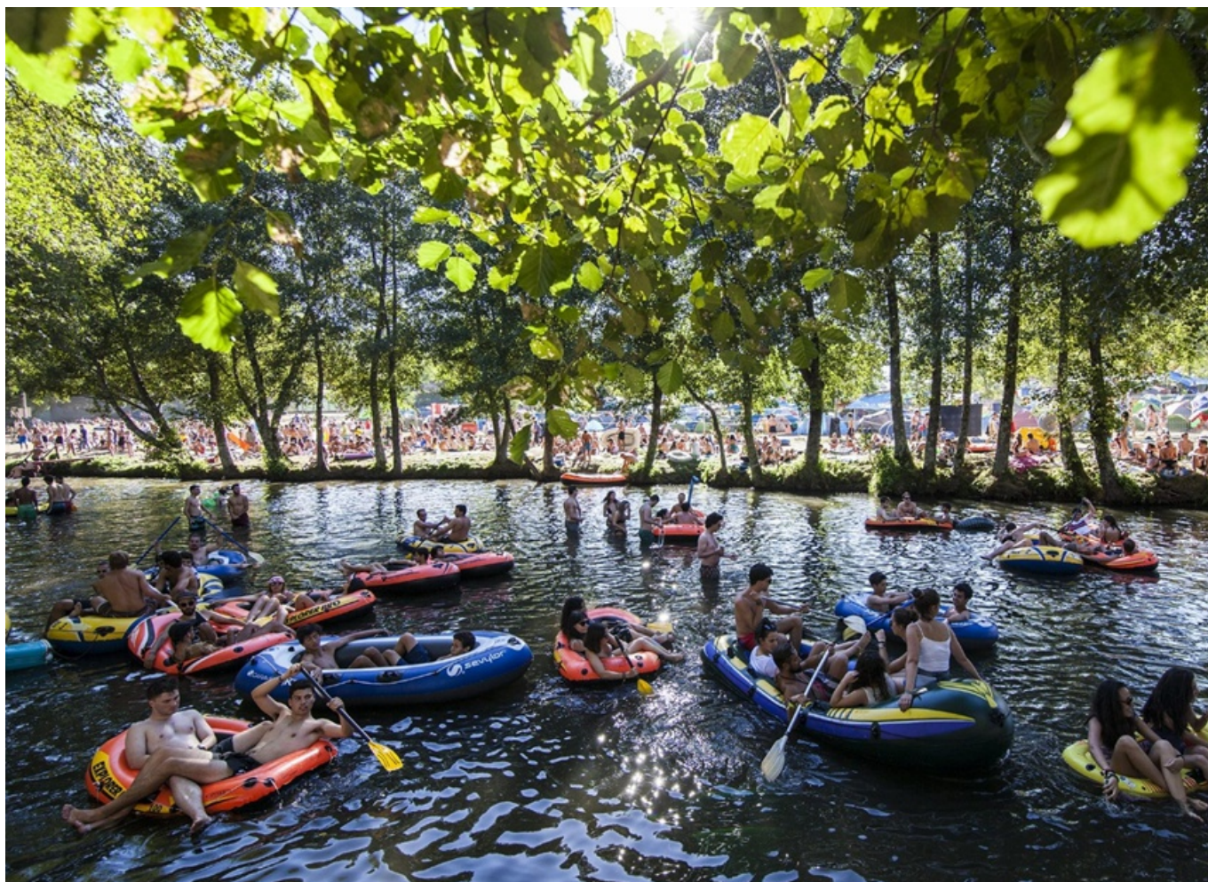
Figura 1: O património pode ser um festival. Festival Paredes de Coura 30 Anos

A noção de identidade, profundamente enraizada na sociologia cultural e nos estudos pós-coloniais, está vinculada ao entendimento de como os indivíduos e grupos constroem suas percepções de si mesmos em relação ao outro. Stuart Hall (1996) oferece uma perspetiva crítica sobre identidade, argumentando que ela não é fixa, mas sim um processo contínuo de construção e negociação, especialmente dentro das culturas pós-coloniais e globais. A identidade, para Stuart Hall (1996), é formada num espaço de diáspora, onde tradições locais se encontram e se reconfiguram em interação com fluxos globais de poder e cultura. Além disso, Anthony Giddens (1991) propõe que as identidades na modernidade tardia são reflexivas, ou seja, são continuamente reavaliadas e recriadas à medida que os indivíduos navegam pelas diferentes demandas e pressões das estruturas sociais contemporâneas (Guerra, 2018). No campo artístico, essa construção reflexiva da identidade é frequentemente visível em obras que questionam as fronteiras entre o público e o privado, o tradicional e o contemporâneo. Proximamente, a nossa reflexão acerca dos festivais de rock como memória e como identidade do contemporâneo é a concretização de tais inquietações (Guerra, 2024, 2016). Essas problematizações tiveram a sua sinédoque no Festival Paredes de Coura que se realiza desde 1993 no concelho de Paredes de Coura no Alto Minho, no Norte de Portugal (Guerra, 2023a, 2023b).