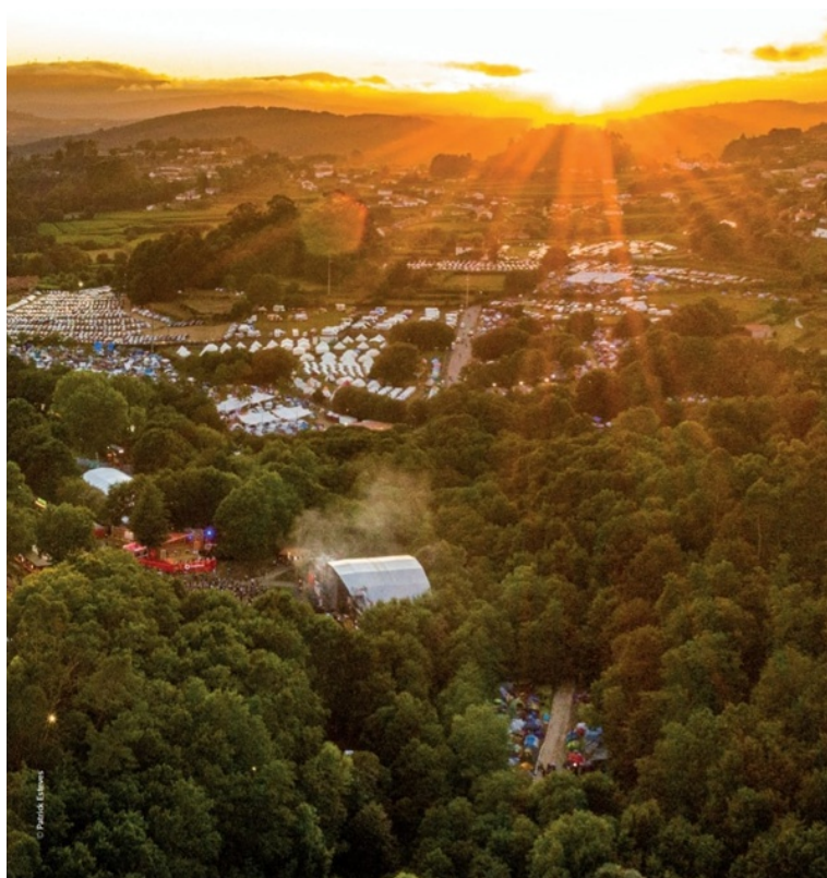
Figura 6: O património pode ser um festival. Festival Paredes de Coura 30 Anos