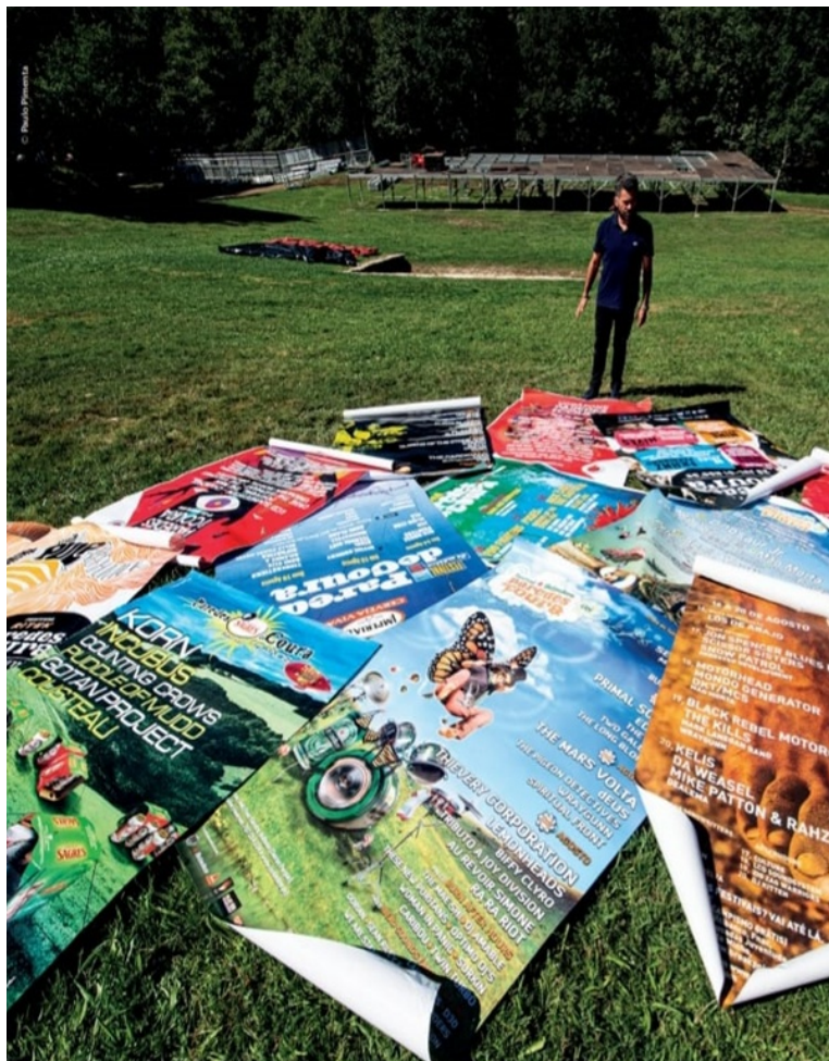
Figura 2: O património pode ser um festival. Festival Paredes de Coura 30 Anos