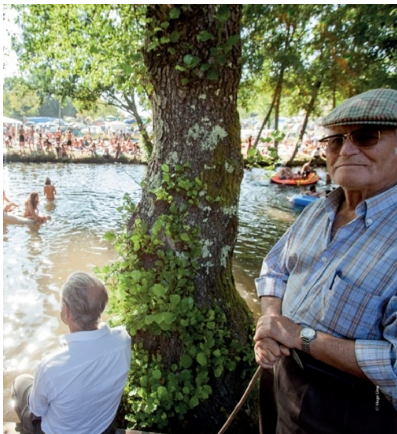
Figura 4: O património pode ser um festival. Festival Paredes de Coura 30 Anos