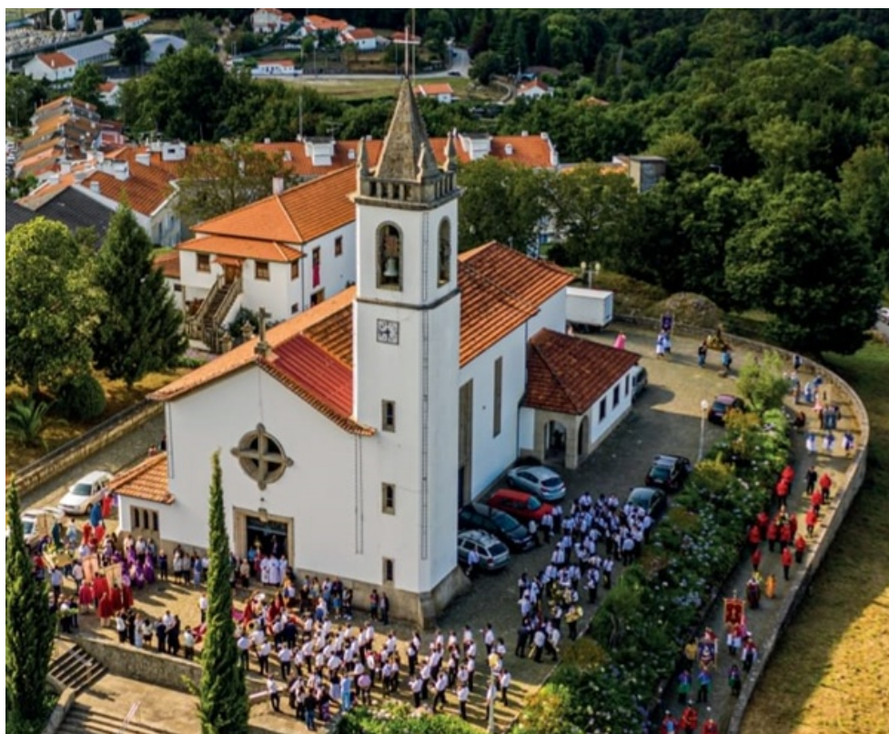
Figura 5: O património pode ser um festival. Festival Paredes de Coura 30 Anos