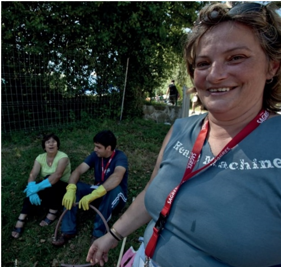
Figura 11: O património pode ser um festival. Festival Paredes de Coura 30 Anos

Este conjunto de obras oferece uma abordagem riquíssima sobre como os espaços culturais e sociais são construídos, negociados e contestados – nas suas memórias, identidades e disputas. Ao juntar arte e sociologia, esta revista busca promover uma reflexão profunda sobre a criatividade como ferramenta de resistência e transformação, tanto no plano individual quanto coletivo. Através destas perspectivas, somos convidados a reconsiderar as fronteiras entre o estético e o social, entre a cultura popular e a academia, revelando novas formas de pensar e criar no mundo contemporâneo.