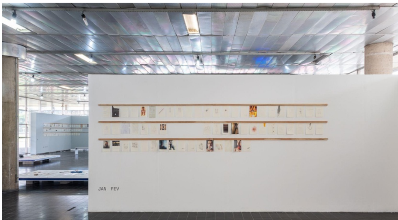
Figura 12: Montagem de Diário 366

montagem em Santo André fizemos também uma espécie de performance chamada de Leitura das cartas ”, era um modo de permitir que a coleção pudesse ser ativada... Cada vez que montamos esse trabalho ele vai se atualizando. As leituras das cartas trouxeram outra perspectiva para mim, porque no final, com os seus objetos, as pessoas escolheram o que queriam que eu soubesse. Mas daí, na leitura, outras camadas foram desocultadas: um objeto pequeno e delicado que eu poderia imaginar estar relacionado a uma viagem ou algo do tipo, na realidade retratava a morte de um amigo, e assim por diante.