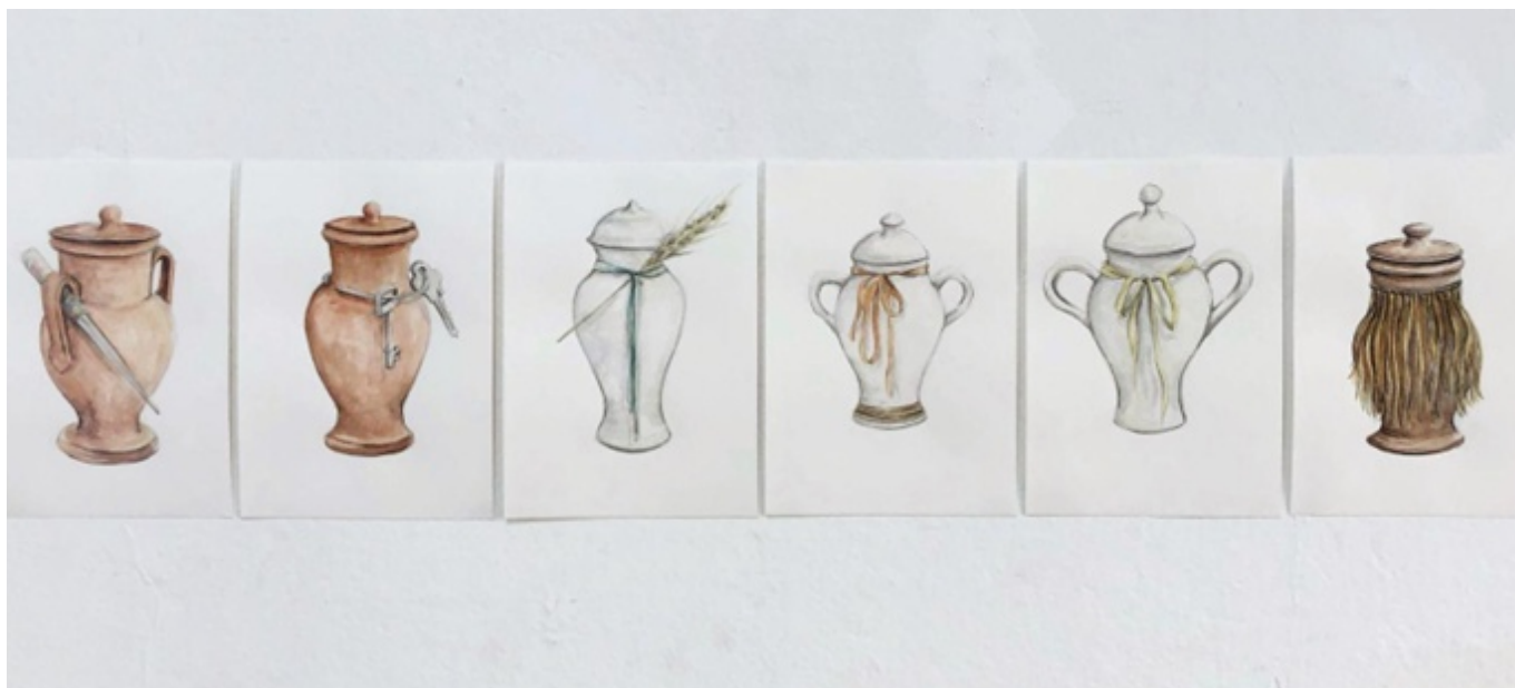
Figura 9: Quartinhos — Voz-rio (2020)