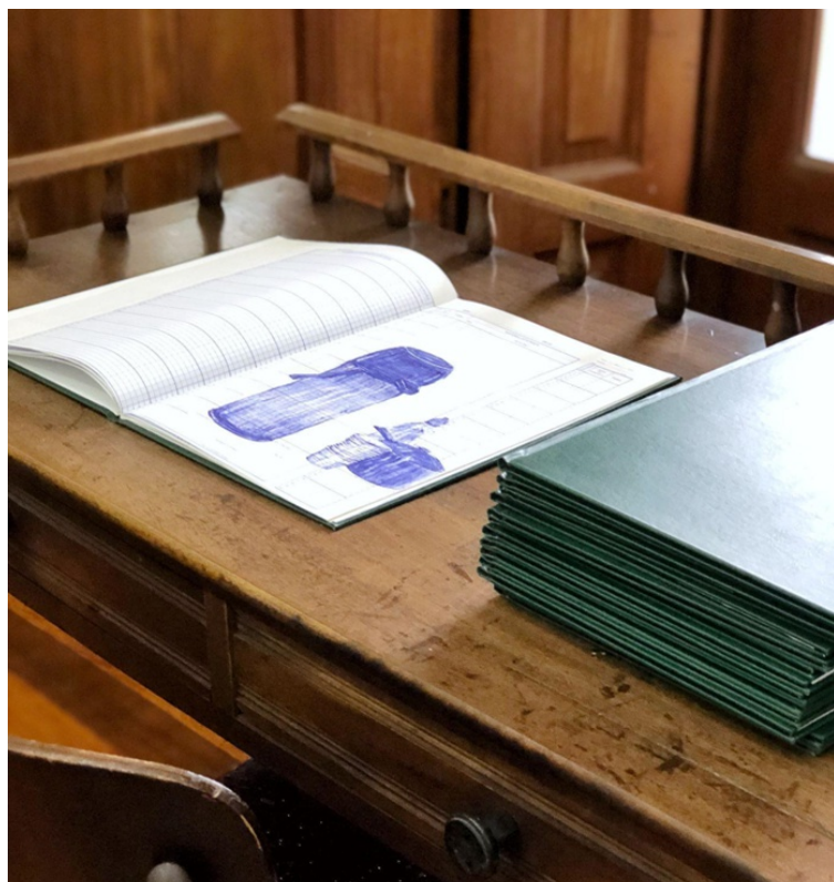
Figura 1: Diários de Classe (2015-2018)