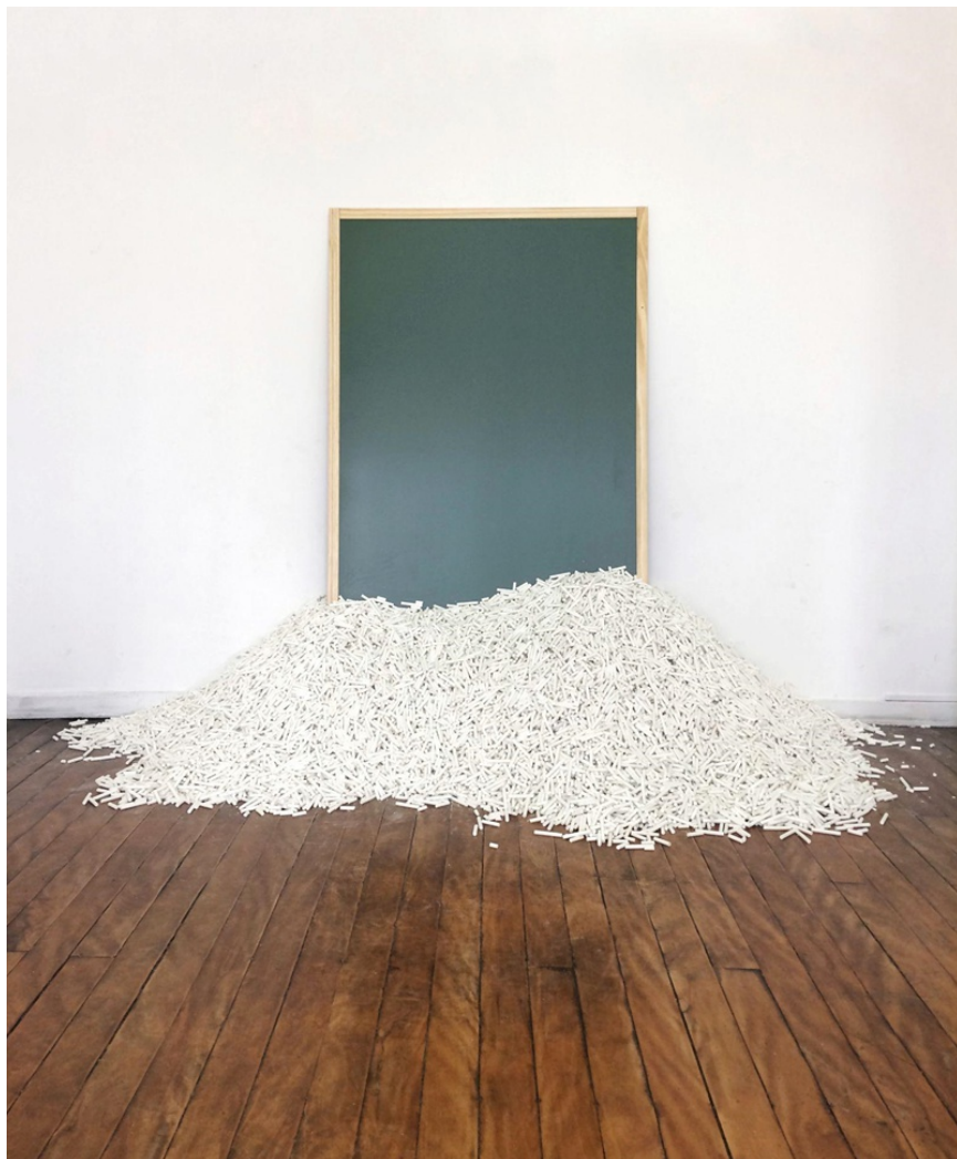
Figura 2: Aula vaga (2018)

[H]: A escola como um campo etnográfico, como uma espécie de ateliê expandido é, então, algo natural.