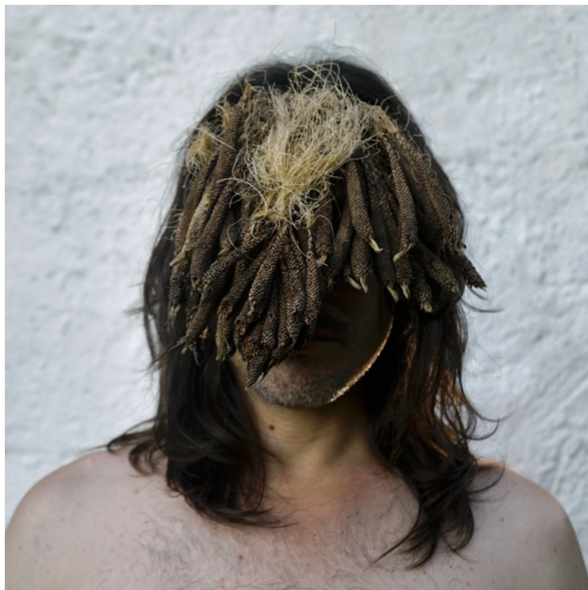
Figura 11: Flor de dendê : Foto-performance realizada durante residência em Itaparica

[H]: O desenho accidental como método, uma forma outra de etnografar os sujeitos da fábrica mas também a passagem do tempo, as condições ambientais. Gosto disso.