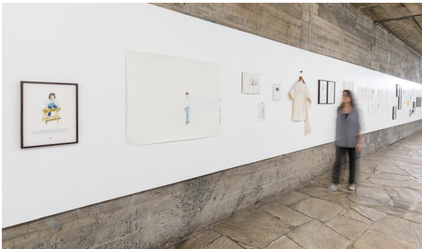
Figura 4: Educação do caráter (2019-2022)