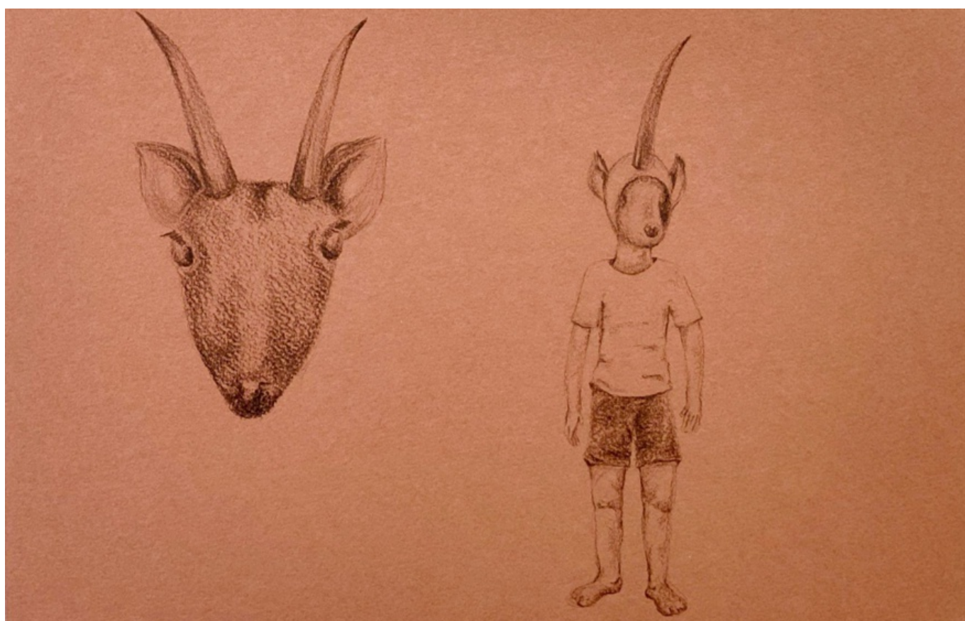
Figura 10: Corpo-porta-tudo: simbiose (2022).