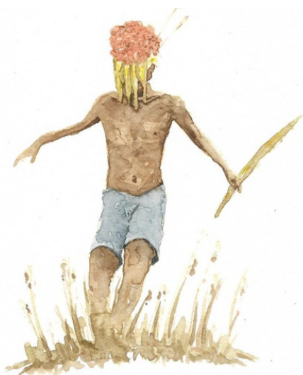
Figura 8: Cabeça-flor (2014-2016)