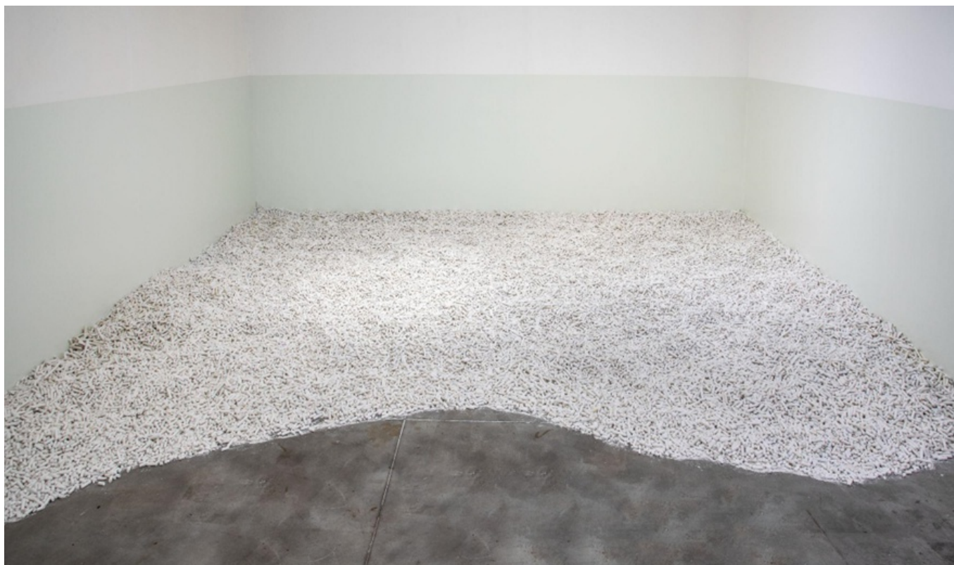
Figura 5: Corpo decente (2018) Créditos: Rômulo Fialdini. Fonte: Cortesia de artista.