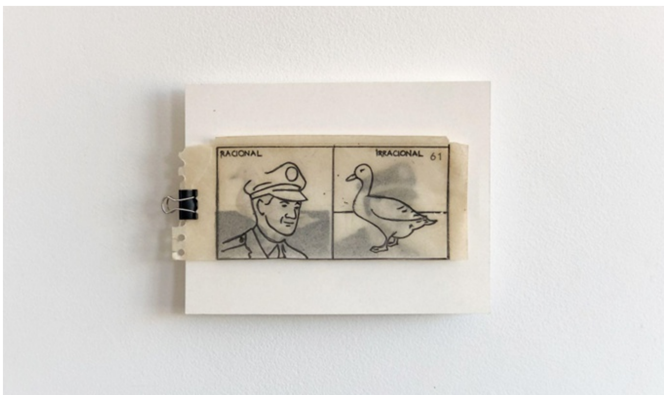
Figura 6: Exercício de revisão (2021-2022)