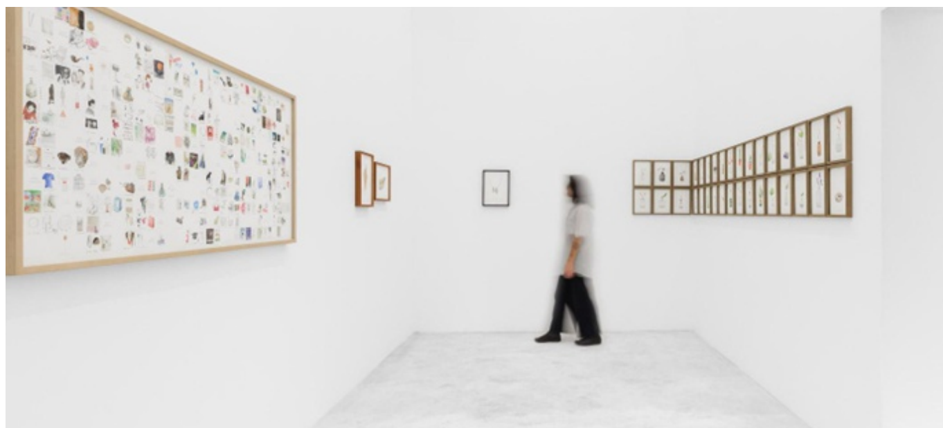
Figura 7: COIRR (2022)