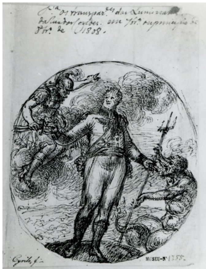
Figura 1: Cirilo Volkmar Machado. Alegoria ao auxílio de Inglaterra em 1808. Desenho. Pena. 207 x 294 mm. Museu Nacional de Arte Antiga