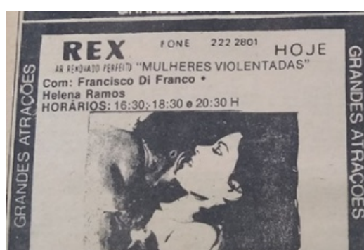
Figuras 5 e 6: Cartazes de filmes com a mesma imagem