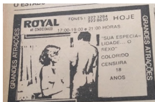
Figuras 1 e 2: Propagandas de filmes com imagens sexuais