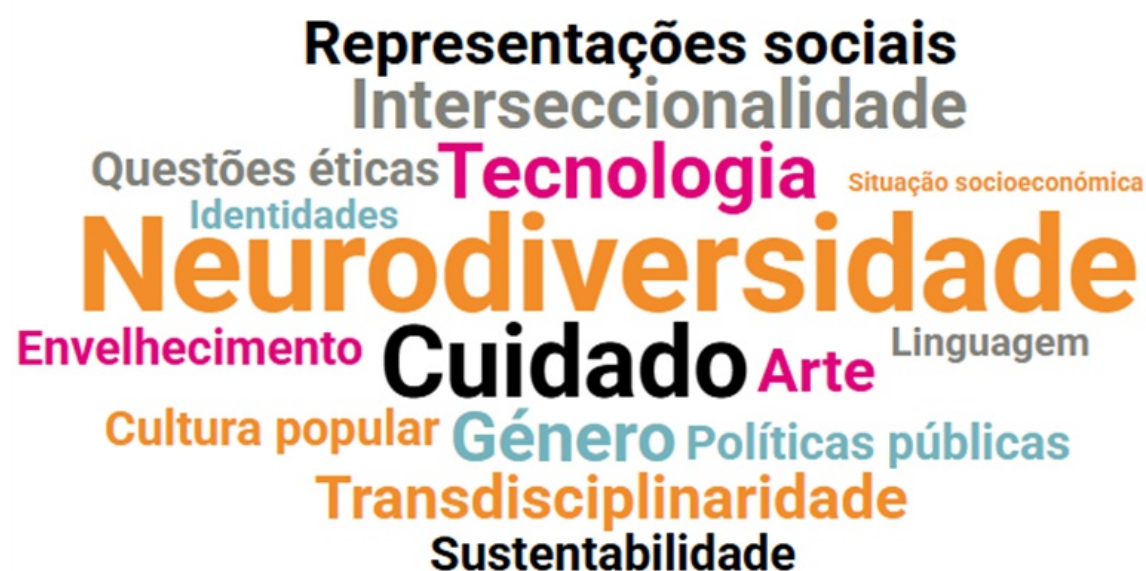
Figura 3: Desafios emergentes nos estudos sociológicos sobre neurodiversidade

cuidado, desigualdade, poder, decolonialidade e produção artística/cultural. Por meio destes debruçamentos, o campo traçado pode contribuir para a compreensão científica da diferença neurológica, para o debate público e para o desenvolvimento de práticas institucionais mais reflexivas e socialmente equitativas. Reconhecer estes limites não enfraquece a proposta aqui presente. Se tanto, reforça a sua credibilidade científica. Ao assumir a complexidade, a ambiguidade e os riscos associados à consolidação deste campo emergente, a sociologia contribui de forma crítica para a compreensão das transformações contemporâneas na forma como a diferença neurológica é interpretada, regulada e vivida na sociedade.