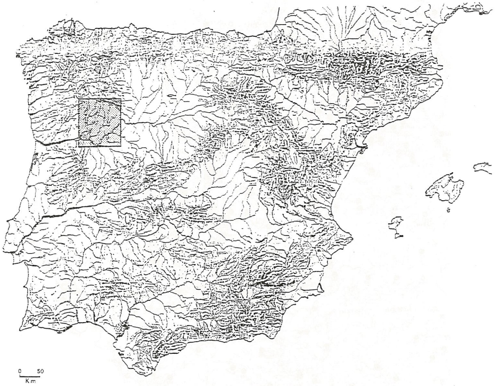
Trás-os-Montes Oriental no Quadro da Península Ibérica.