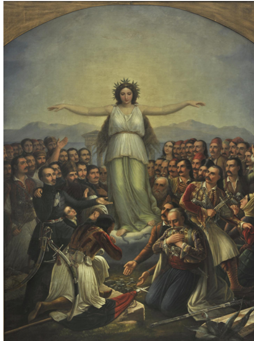
Figure 3. Theodoros Vryzakis, Greece expressing gratitude (1858), oil on canvas, 215 cm x 157 cm, National Gallery, Hellenic Army Park, Goudi. 4