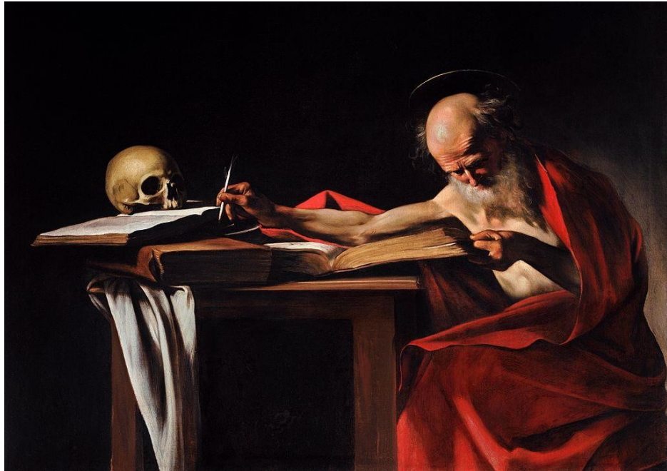
Figure 2. Caravaggio, Saint Jerome Writing (1605-1606), oil on canvas, 112 cm x 157 cm, Galleria Borghese. 4

It is intriguing to imagine what Caravaggio is thinking about while working on this painting and equally intriguing, if not more so, to imagine Saint Jerome himself translating the fifth verse of the Song of Songs as he sits at his writing table, surrounded by thick folds of blackness. Jerome's exegetical sources were allegorical, as noted, pointing to blackness as sin. Indeed, the translation would cast doubt on the beauty of blackness itself. And yet, here in this painting, blackness is the very thing that gives light to the imagined writer and certainly to the painting itself.